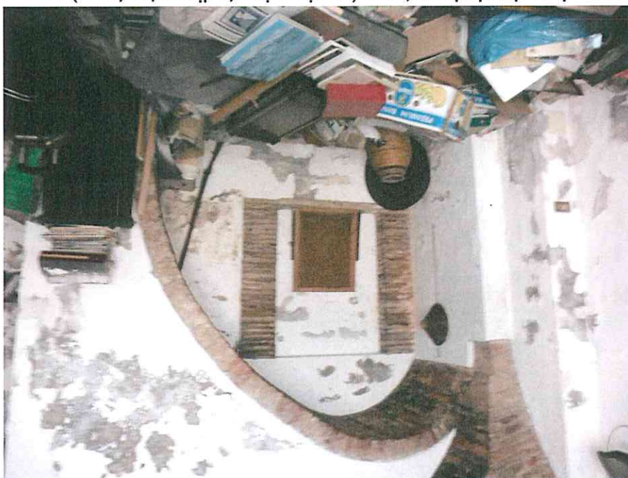
Locale al piano terra (vista soffitto a volta)