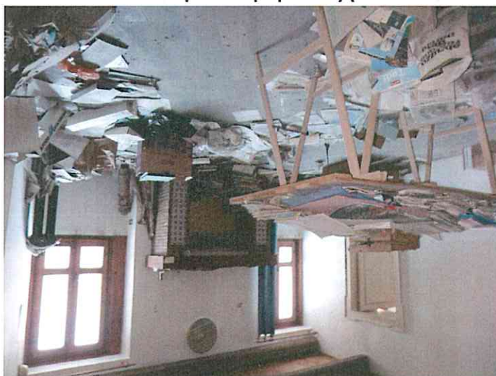
Allegato 1 - Documentazione Fotografica