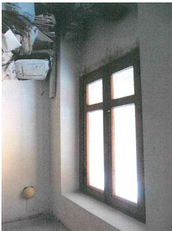
Vano al piano primo