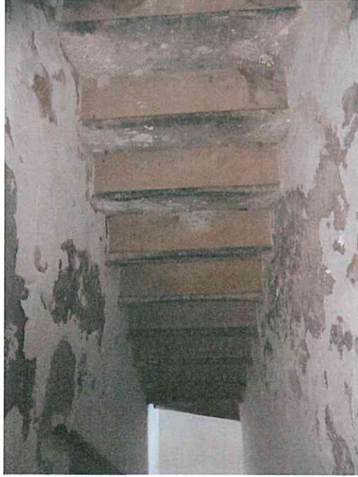
Altro vano al piano primo