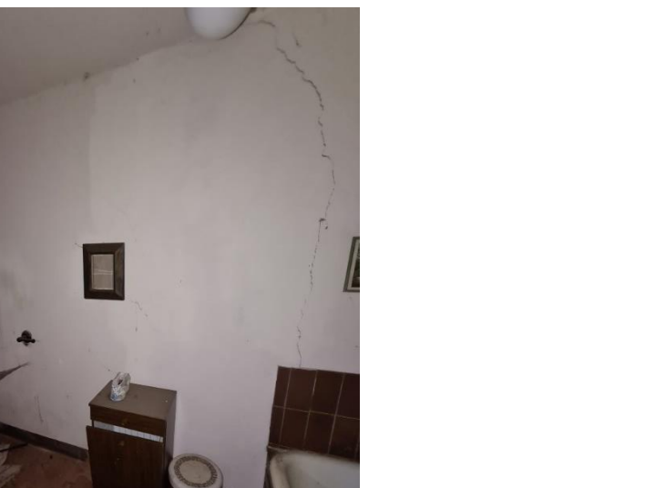
PIANO PRIMO ABITAZIONE