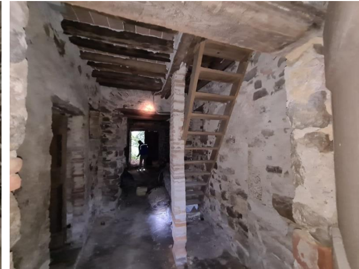
PIANO TERRA USO CANTINE